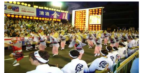
夏の風物詩 阿波踊り[徳島県]

3、終盤は駒の損得よりもいかにして相手玉に迫るかという寄せ合いのステージ。ということになります。